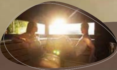
8 heerlijke sauna's